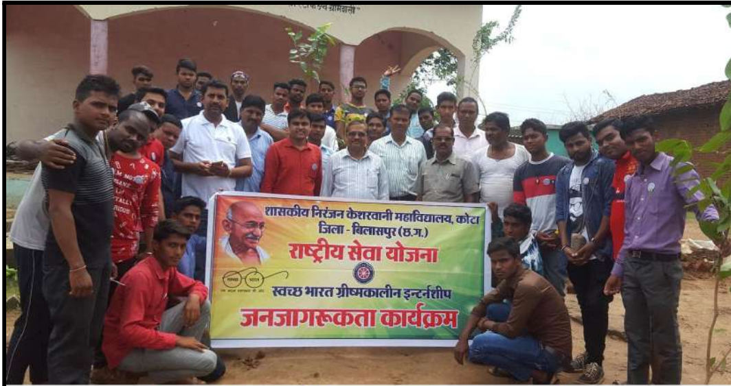
स्वच्छ भारत ग्रीष्मकालीन इन्टरनीप : जनजागरूकता कार्यक्रम 27.07.2018 ग्राम-लारीपारा, वि.ख.-छेरकाबांधा, जिला-बिलासपुर (छ.ग.)